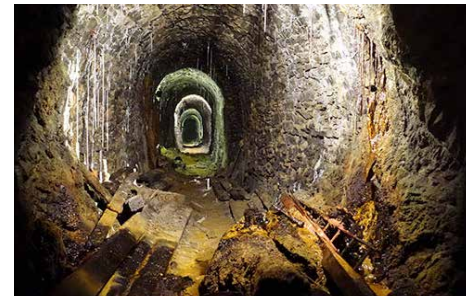
Blick in die Kaneuhler Seil- und Gestängestrecke