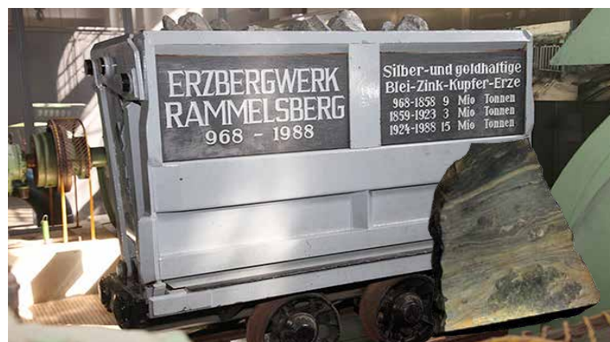
Erzförderwagen im Museum