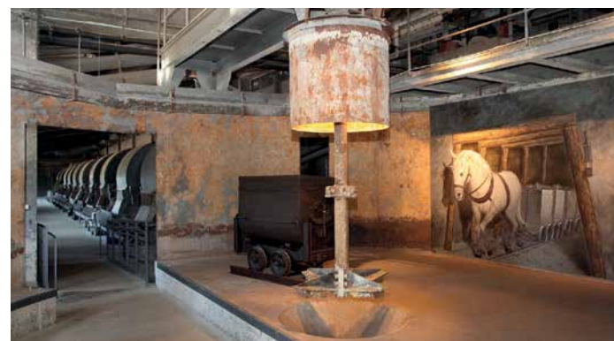
Aufbereitung des Erzbergwerks Rammelsberg