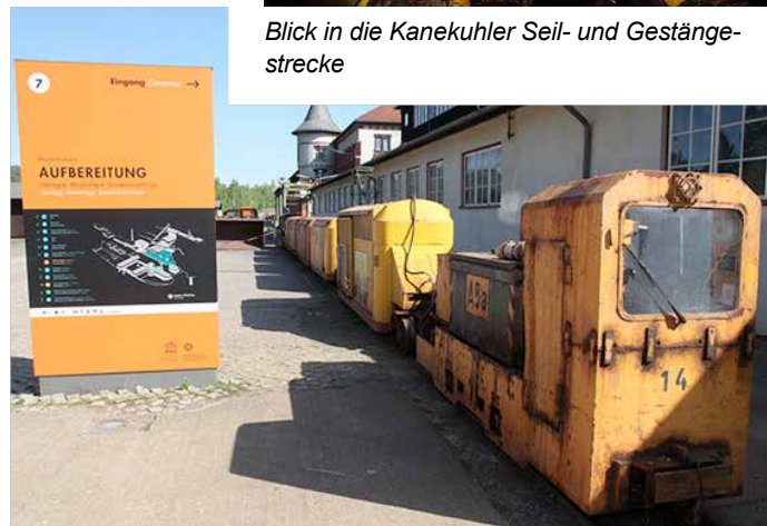
Grubenbahn am Gebäude der Aufbereitung