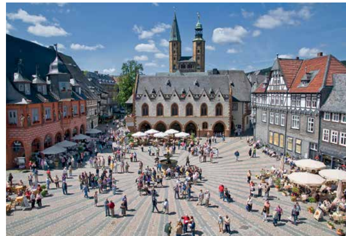
Marktplatz und Rathaus in Goslar