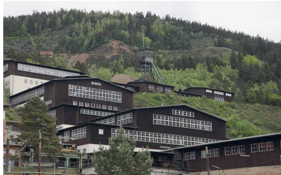
Unesco Weltkulturerbe Erzbergwerk Rammelsberg